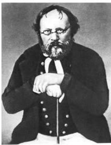
Retrato de Joseph Proudhon